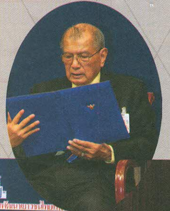
พิธีมอบพระพุทธรูปประจำห้องเรียน